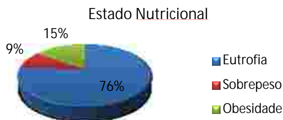
Figura 1 – Classificação do estado nutricional das crianças assistidas pela RIMS.

Com relação ao IMC, 9% da amostra foi classificada como sobrepeso e 15% como obesidade, conforme a figura 1. Já no que diz respeito à circunferência abdominal, 9% da amostra apresentou a medida acima do percentil 90 para idade e sexo, o que indica que essas crianças apresentam obesidade abdominal.