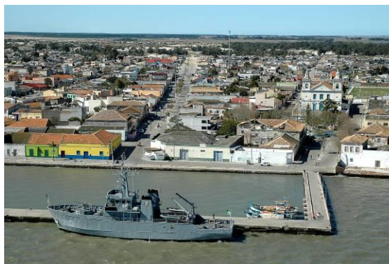
Figura 1: Cidade de São José do Norte/RS, relação do ambiente construído com a paisagem natural.

O estudo optou pelo método de estudo de caso que está vinculado às questões de pesquisa; a escolha pelo caso único se deve às características da cidade serem peculiares (YIN, 2010). Assim, o município de São José do Norte/RS, foi escolhido, como caso de estudo, por estar contíguo à Laguna dos Patos e possuir prédios de importância histórica (Figura 1). Assim, um recorte definiu quatro ruas para a análise da qualidade visual do ambiente e da relação com o ambiente natural.