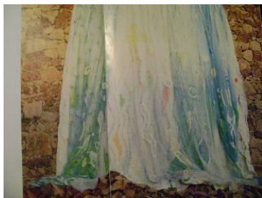
Figura 2 – A cachoeira, 1985.

Outra obra do mesmo período caracteriza a linguagem de apropriação das imagens da memória coletiva, como vemos na figura 2, em “A cachoeira” a figura dos peixes pintados sobre uma cortina de banheiro é somada ao efeito óbvio provocado pelo título e sugere a proximidade com o espectador.