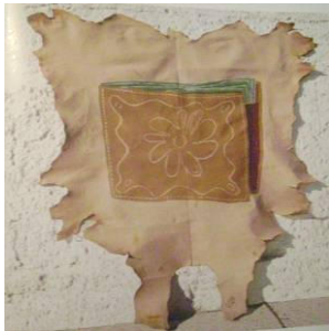
Figura 1 – A carteira, 1985.

Este hibridismo plástico, como já citado anteriormente, está ligado à relação existente entre Leda e os materiais que utiliza e a memória, memória visual e subjetiva a qual reforça seu repertório imagético, relacionando as imagens próprias dos materiais e tecidos utilizados na obra e as imagens cotidianas, arquetípicas presentes na memória coletiva e que ganham um novo significado através da costura e da ação da tinta. Podemos verificar estas relações através de algumas de suas obras aqui relacionadas, como por exemplo, na figura 1, “A carteira”, trabalho de 1985.