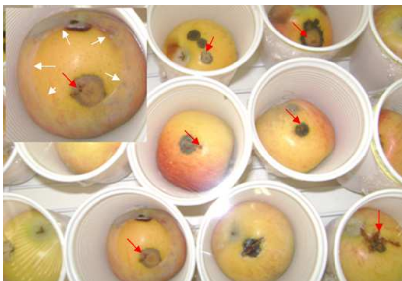
Figura 1. Frutos de maçã parafinados com presença da sarna da macieira, 10 dias após a infestação de Grapholita molesta em laboratório. As setas brancas mostram a delimitação da área com parafina e as vermelhas o local de penetração da lagarta, identificado pela presença de serragem.

da lagarta penetrar no fruto, pois a mortalidade em seu interior é baixa. Neste caso, a presença de lesões causadas pela doença ampliaria as chances de sobrevivência do inseto reduzindo o período no qual as lagartas estariam mais expostas à ação de inseticidas, visto a grande dificuldade de controle do inseto quando este se encontra no interior dos frutos. Além disso, a rápida penetração das lagartas nos frutos reduziria a chance de fatores bióticos (ex: inimigos naturais) e abióticos (ex: clima) atuarem sobre o inseto.