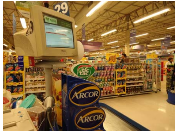
Figura 2 - Visão que o operador tem do monitor