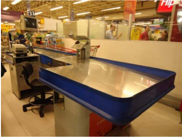
Figura 1 - Visão geral do box atual

O monitor utilizado nos boxes é de tecnologia CRT ( Cathode Ray Tube ), e se encontra suspenso a 50 cm da esteira, como pode ser observado na Figura 2.