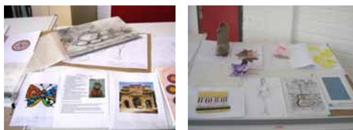
Figura 3 - Exposição de parte dos trabalhos da turma de Artes Visuais T2 da disciplina de Construções Geométricas.

A conscientização do aluno da importância e da presença constante dos conhecimentos geométricos nos processos criativos e didáticos foi estabelecida principalmente com essa atividade. Nesta, a interdisciplinaridade que configura esse método, se manifesta nas reflexões conjuntas dos alunos acerca das Artes e do Desenho Geométrico. Do resultado deste processo, foram expostos os trabalhos para toda a turma. Além de estarem divulgando a sua arte estavam compartilhando também suas experimentações técnicas, conforme mostra a figura 3, de parte da exposição.