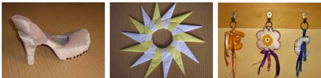
Figura 5 - Exemplos de peças produzidas pelos alunos.

Todas as peças produzidas pelos alunos foram digitalizadas (Figura 5), dentro de uma perspectiva de trabalho que pretende a estruturação de objetos de aprendizagem em meio digital. Este trabalho apresentado está vinculado a projeto que busca configurar atividades que possam ser disponibilizadas como propostas didáticas de ensino, tanto para a modalidade presencial como a distância. Neste sentido, a publicação do projeto e dos resultados obtidos, possibilita a discussão, aplicabilidade e avaliação em contexto ampliado, garantindo a expansão e a continuidade do projeto.