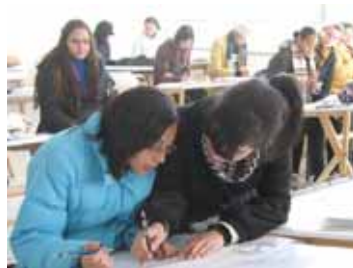
Figura 4- Alunos trabalhando em sala de aula.

Ao final do período letivo foi constatado que não houve evasão na turma e todos os alunos foram aprovados com nota superior a sete. Todos os estudantes executaram a atividade solicitada, apresentando propostas com grande diversidade de técnicas criativas, confirmando o registro de Rinaldi (2007) quando afirma que “a descoberta de uma representação gráfica diferenciada pode diminuir a resistência que os alunos têm em relação à geometria”. A variedade de propostas gerou alunos interessados, concentrados no trabalho, desinibidos aos questionamentos e discussões, demonstrando efetiva apropriação dos conhecimentos da disciplina, pois afinal estavam discorrendo sobre sua criação e seu desenvolvimento técnico. A estruturação da atividade didática, aberta aos interesses do grupo, instaurou uma maior motivação para o exercício e aprendizagem. O grupo revelou-se colaborativo, apresentando autonomia nas etapas de criação e reflexão, participando ativamente da análise e avaliação do processo. Conforme, observa-se na foto da turma em sala de aula, na figura 4.